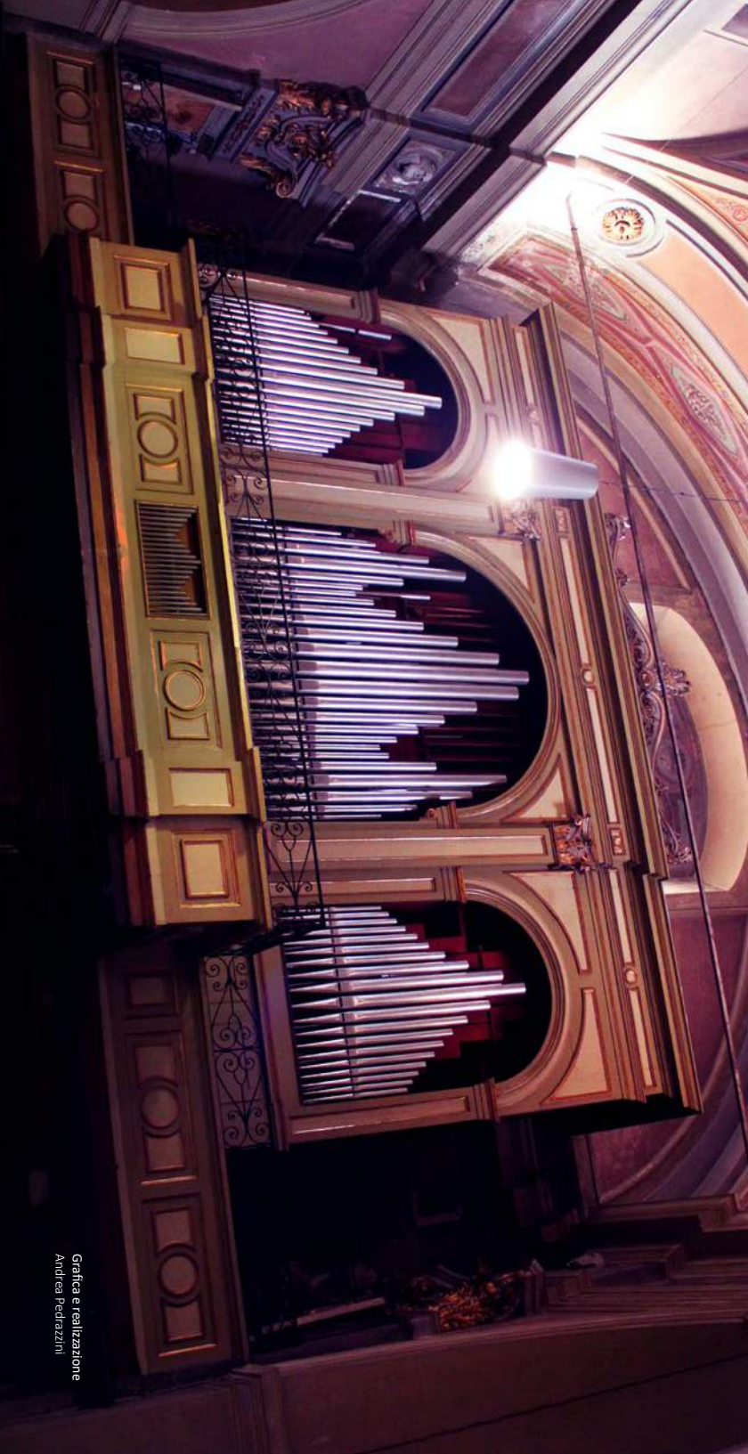
Grafica e realizzazione Andrea Pedrazzini