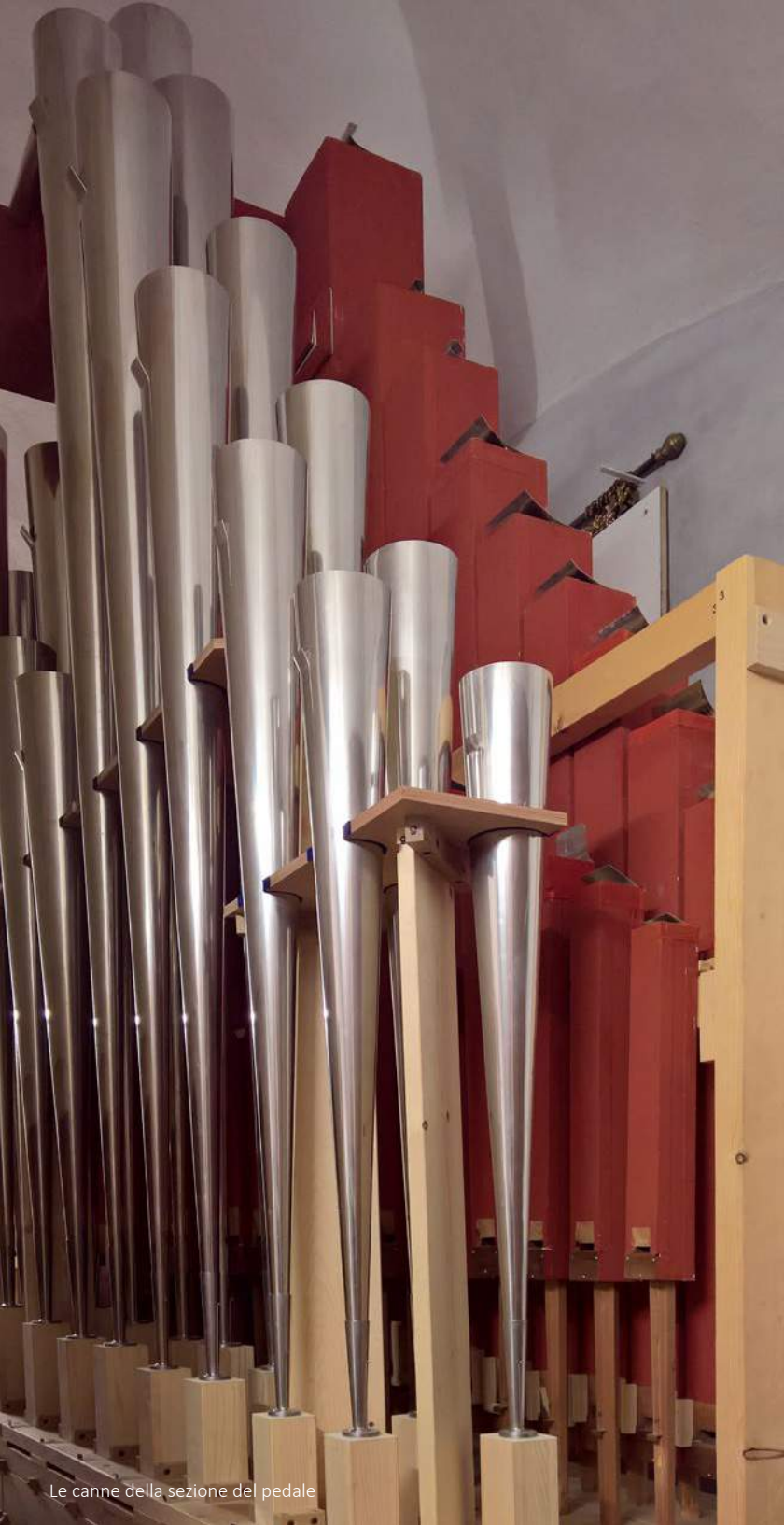
Le canne della sezione del pedale