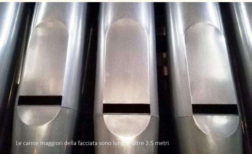
Le canne maggiori della facciata sono lunghe oltre 2.5 metri

Nel 1984 l'Associazione ricerche musicali nella Svizzera italiana consigliò al Municipio un restauro dell'organo nuovamente condannato al silenzio dal progressivo processo di deperimento. Avendo riconosciuto il valore storico degli organi costruiti sull'esempio di Serassi dalla ditta Bossi Urbani, il Consiglio Comunale di Locarno votò nel marzo del 1986 il credito necessario per il restauro. Dopo le necessarie analisi degli esperti, nel marzo del 1988 fu pubblicato il relativo capitolato di concorso per "il restauro dell'organo sito nella collegiata di St. Antonio abate e S. Vittore martire a Locarno."