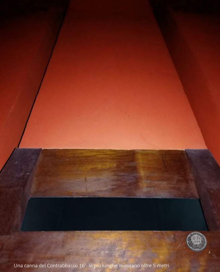
Una canna del Contrabbasso 16': le più lunghe misurano oltre 5 metri.

Nel dicembre del 1990 il municipio chiese un credito suppletorio per la completazione del restauro affidato alla ditta Italo Marzi di Pongo che, oltre ad essere la migliore offerente, risultava essere la più disponibile ad eseguire i lavori nei termini richiesti. Fu inoltre previsto un contributo straordinario per le giornate inaugurative di quest'organo ed il restauro "conservativo e integrativo" terminò nel maggio del 1991.