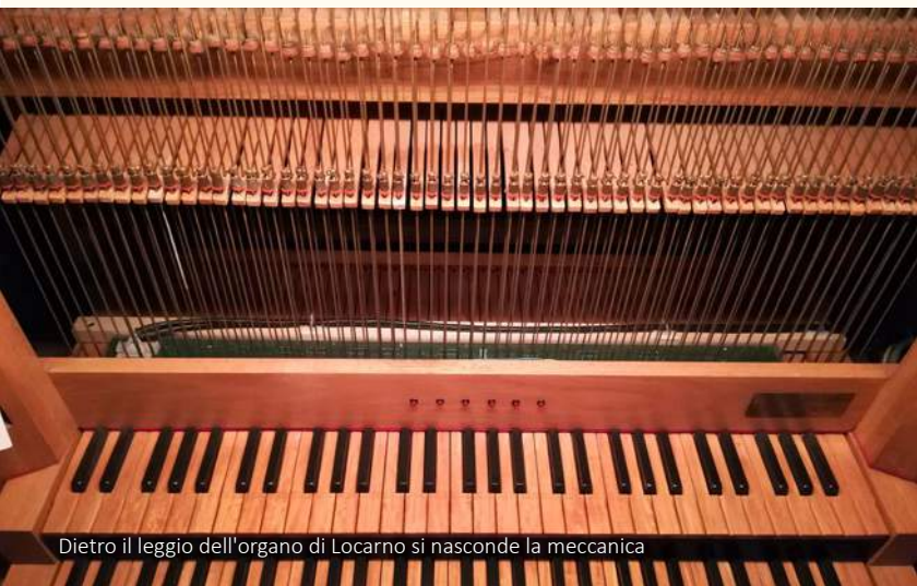
Dietro il leggìo dell'organo di Locarno si nasconde la meccanica