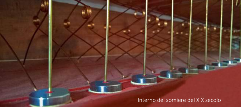
Interno del somiere del XIX secolo

D'altro canto, la sonorità cristallina del bel Ripieno dell'organo di Brione, oltre a fornire ulteriore spinta sonora verso l'acuto allo strumento, dotandolo del necessario equilibrio per bilanciarsi all'interno dello spettro acustico che sarebbe altrimenti eccessivamente sproporzionato verso il grave, ne avrebbe allargato enormemente la versatilità, consentendo l'esecuzione di un repertorio molto ampio.