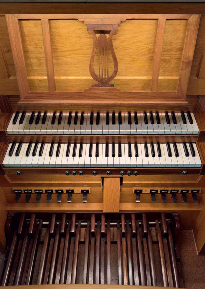
La consolle dell'organo di Brione