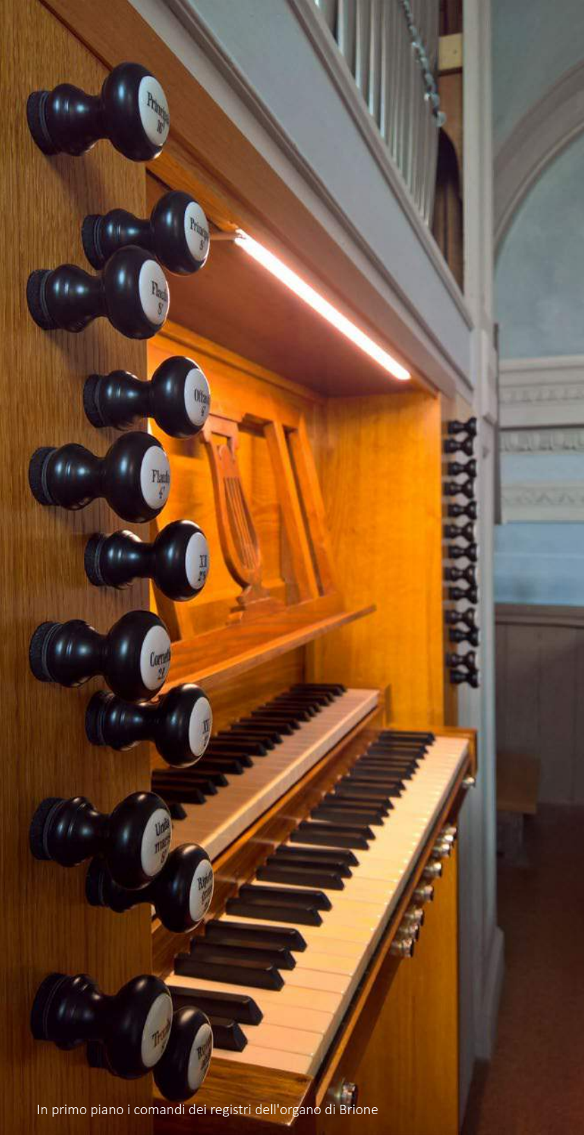
In primo piano i comandi dei registri dell'organo di Brione