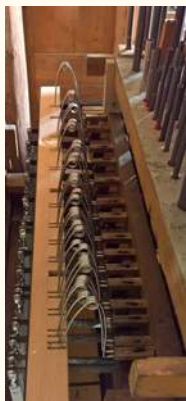
Azionamento dei pettini del somiere maestro

D'altro canto, la sonorità cristallina del bel Ripieno dell'organo di Brione, oltre a fornire ulteriore spinta sonora verso l'acuto allo strumento, dotandolo del necessario equilibrio per bilanciarsi all'interno dello spettro acustico che sarebbe altrimenti eccessivamente sproporzionato verso il grave, ne avrebbe allargato enormemente la versatilità, consentendo l'esecuzione di un repertorio molto ampio.