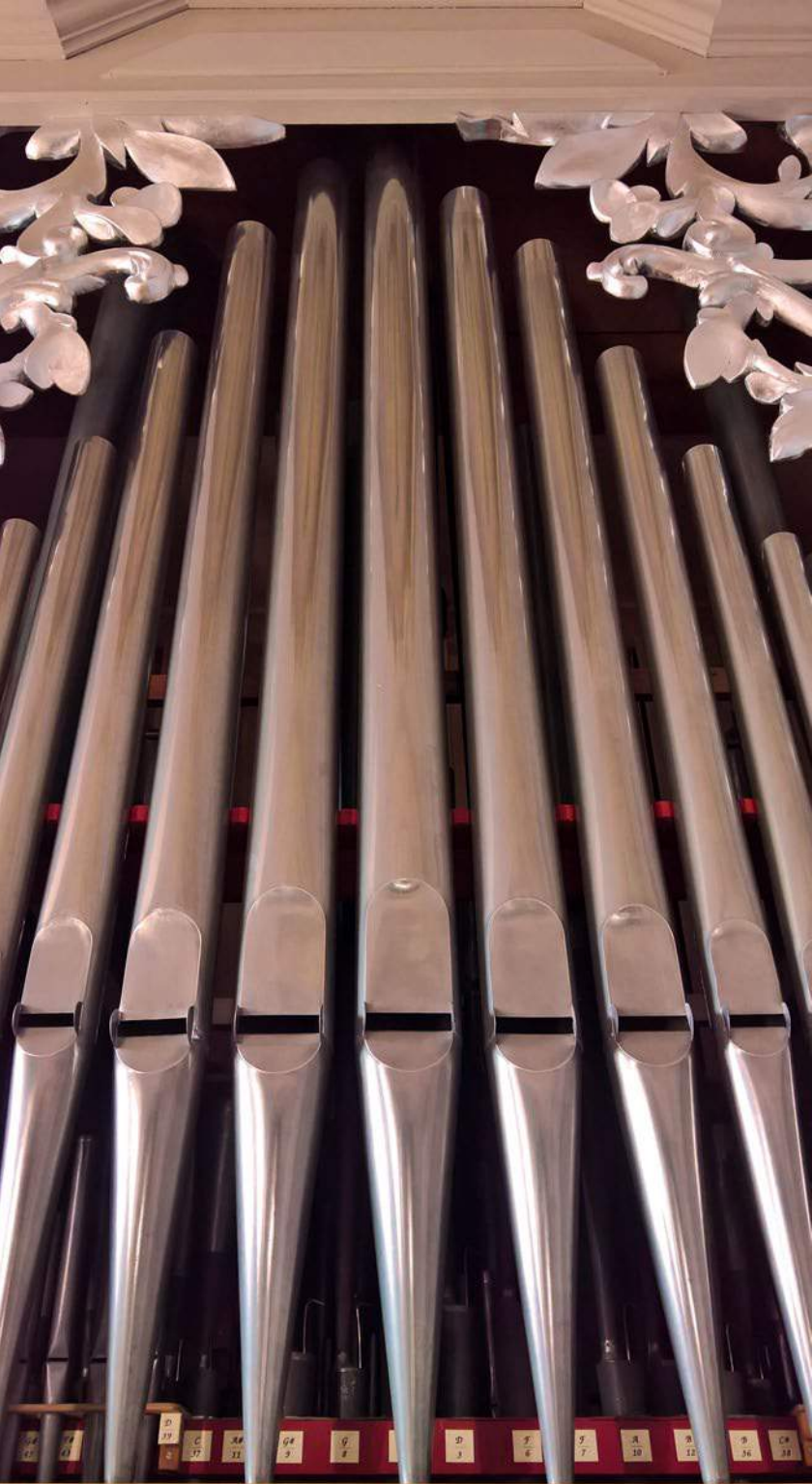
Dettaglio della facciata dell'organo di Brione: le canne in mostra sono del Principale 8'