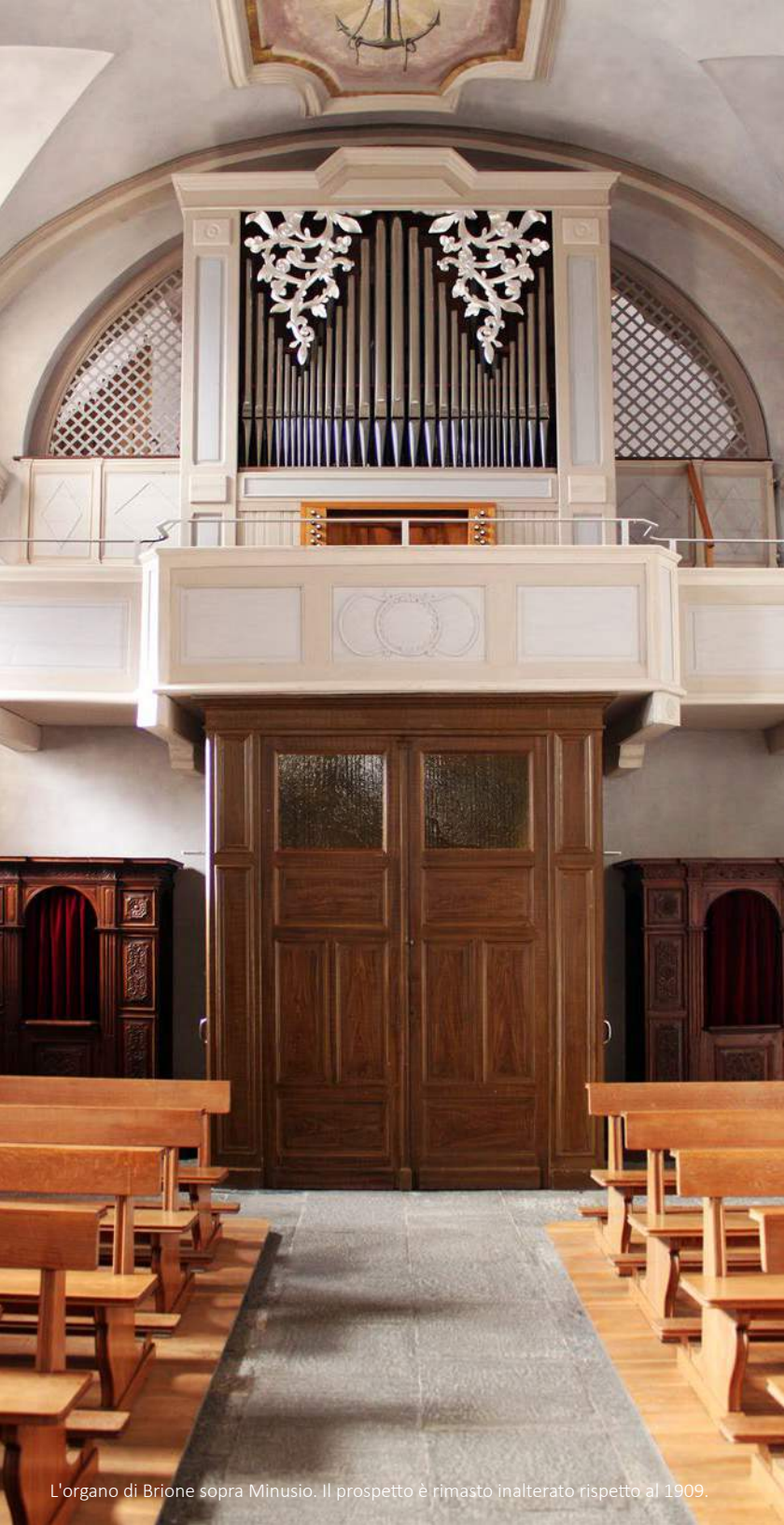
L'organo di Brione sopra Minusio. Il prospetto è rimasto inalterato rispetto al 1909.