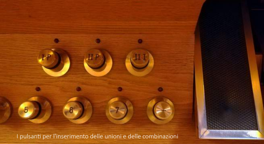
I pulsanti per l'inserimento delle unioni e delle combinazioni

Oltre al rinnovato organo della Collegiata, la fervida attività artistica degli ultimi anni è stata determinante per stimolare l'esecuzione di altri importanti restauri e ampliamenti degli strumenti nella regione. Fra questi l'organo della Parrocchiale di Brione s. Minusio, che è stato restaurato nella parte storica nonché notevolmente ampliato ed inaugurato lo scorso anno dal più rinomato organista mondiale, Olivier Latry, organista della cattedrale di Notre-Dame a Parigi, e l'organo della Parrocchiale di Solduno, in fase di completo restauro, che verrà inaugurato quest'anno.