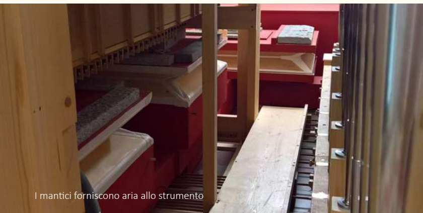
I manti forniscono aria allo strumento

L'ambizioso progetto per l'organo di Brione ha dunque preso le mosse da qui, ed in particolare dalla volontà di realizzare uno strumento in grado di restituire, con proprietà di stile, il repertorio romantico-sinfonico, con particolare riferimento alla scuola francese. Fondamentali in questa estetica sono principalmente due sonorità: i cosiddetti fondi, ossia registri labiali di 16, 8 e 4 piedi che compongono la sonorità base dell'organo e che, nell'estetica romantica, simulano sull'organo il maestoso impasto sonoro degli archi dell'orchestra sinfonica e le ance che, rinchiuso in cassa espressiva, devono fornire allo strumento la capacità di ricreare il crescendo dell'orchestra sinfonica ruolo in quel caso assunto principalmente dai corni francesi.